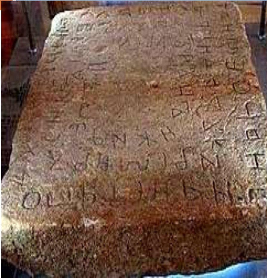
HUMAČKA PLOČA(kraj X i početak XI vijeka)