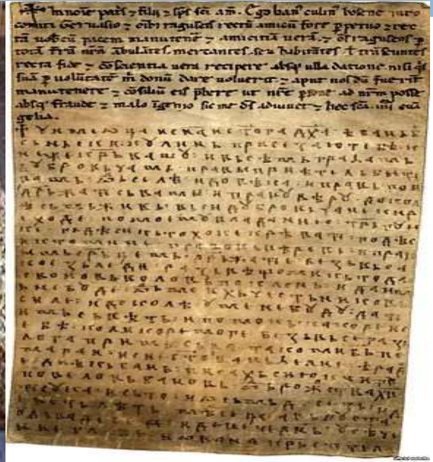
Povelja Kulina bana-1189. god.